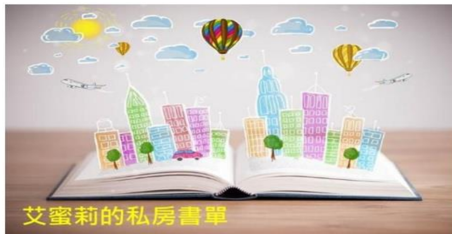
艾蜜莉的私房書單